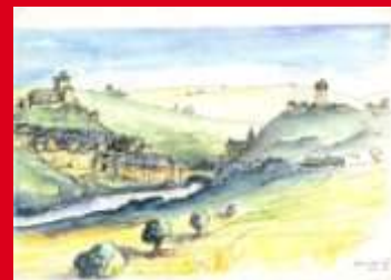
Le château vieux et le donjon face à face