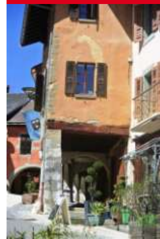
Place du Trophée

Par ses artisans présents sur les foires d'Annecy, de Chambéry, du Châtelard à Bellegarde, la cité albygeoise rayonnait bien au-delà de ses murs.