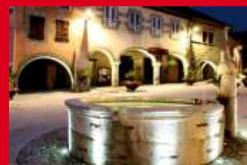
Fontaine du Trophée