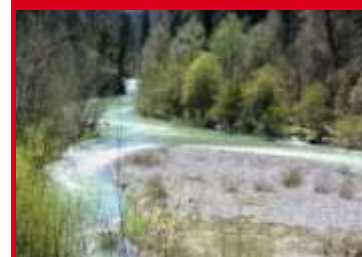
Les méandres du Chéran