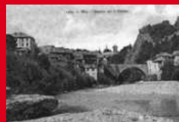
Le Pont Vieux