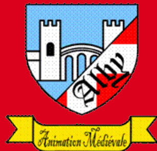
Le Pont Vieux

Au cours des siècles, la cité albigeoise a su abriter une intense activité économique. Autrefois ville de cordonniers, elle accueille depuis 1984 une zone industrielle dynamique placée au cœur d'un courant d'échanges régionaux et internationaux.